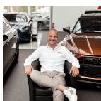
Neuwagen Verkaufsberater Audi