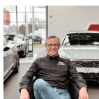
Neuwagen Verkaufsberater Audi