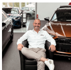
Neuwagen Verkaufsberater Audi