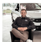
Neuwagen Verkaufsberater VW