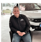
Neuwagen Verkaufsberater VW