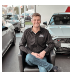
Neuwagen Verkaufsberater VW