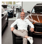
Neuwagen Verkaufsberater Audi