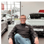
Neuwagen Verkaufsberater Audi